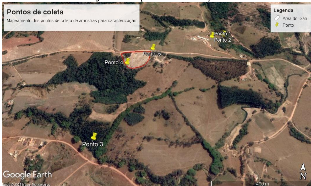
Figura 1 - Pontos para coleta e caracterização