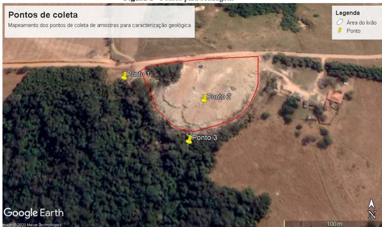
Figura 1 - Pontos para sondagem