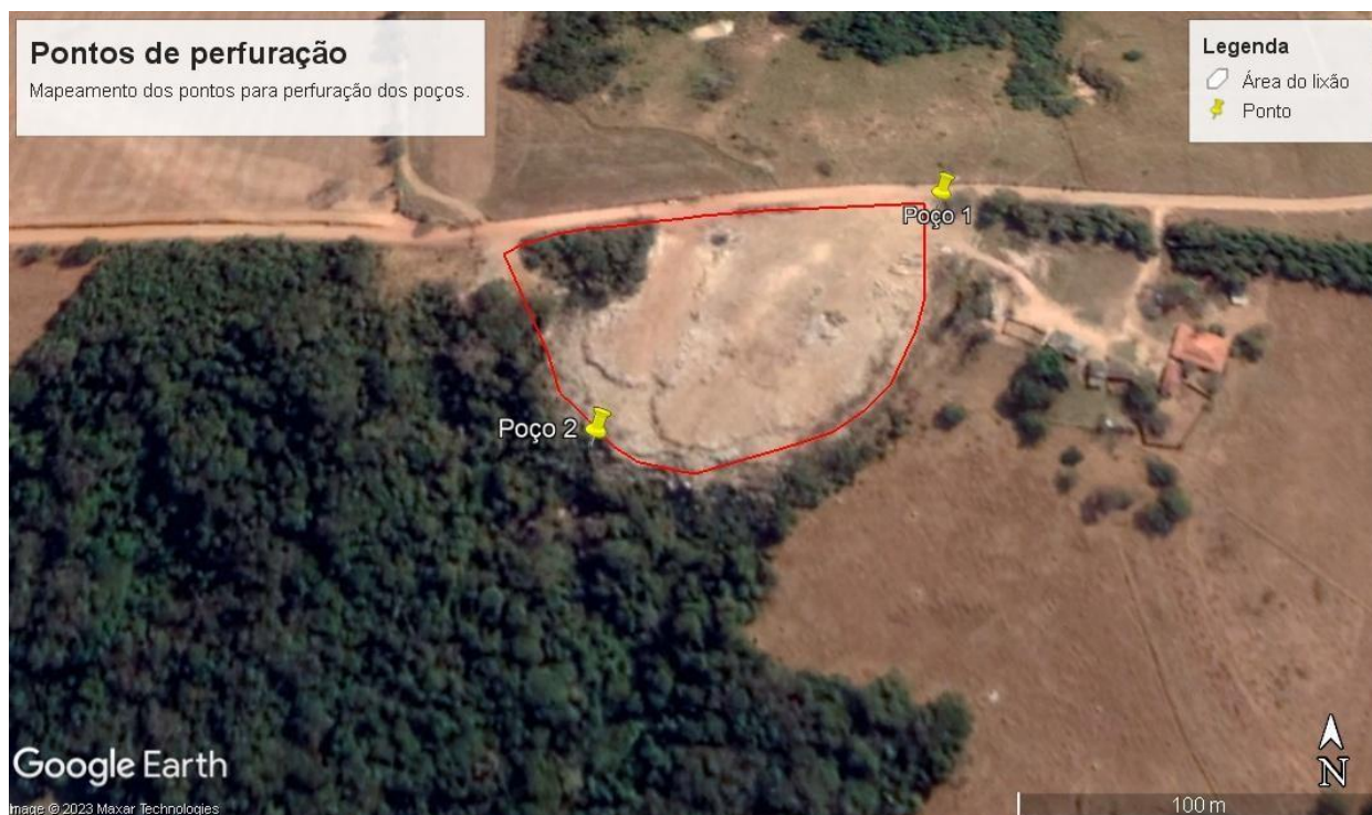
Figura 1 - Pontos para perfuração dos poços de monitoramento da qualidade da água.