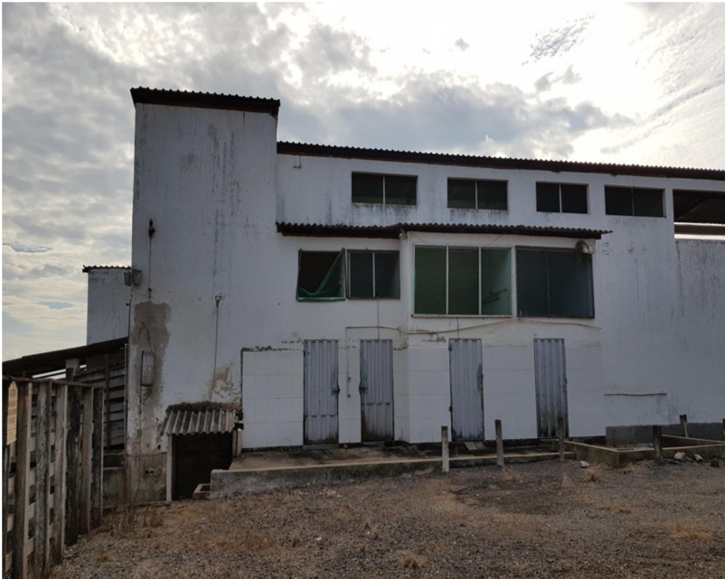
Tanque de decantação de rejeitos (Sangue)