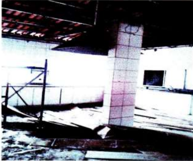
C) LAJE/VIGA COZINHA

Telefone: (35) 3864-1696 e-mail: larvicentino@perdoesnet.com.br